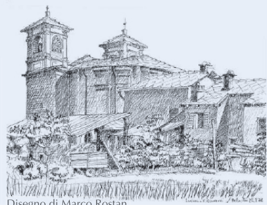
Disegno di Marco Rostan

Visita il Sito internet e la Pagina Facebook